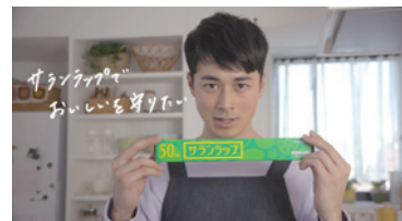
旭化成「サランラップ」

日本サッカー協会「明治安田生命 2016 Jリーグチャンピオンシップ決勝ドキュメンタリー」 乃木坂 46「乃木坂 46 の握手会についての事柄」 主婦の友社 COSMOPOLITAN「最高の出会い」 NBCユニバーサル・エンターテイメントジャパン「ワイルド・スピード SKY MISSION」