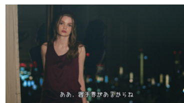
乃木坂 46「乃木坂 46 の握手会についての事柄」