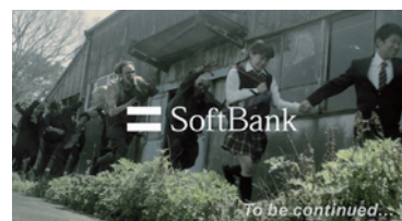
ソフトバンク「DAWN OF THE SoftBank」