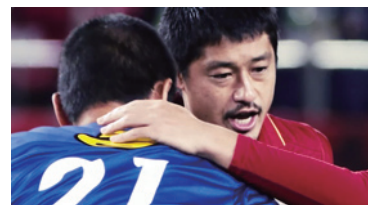
日本サッカー協会「ドキュメンタリー」