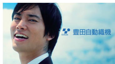
豊田自動織機「創ろうの歌」