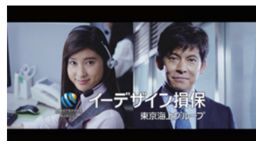
イーデザイン損害保険「自動車保険」