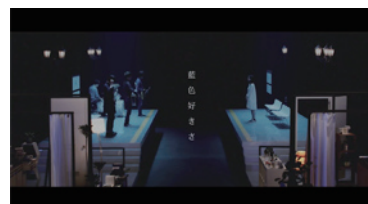
indigo la End「藍色好きさ」