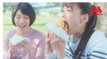
モスフードサービス「企業」