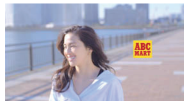
ABC MART「Reebok SKYCUSH」