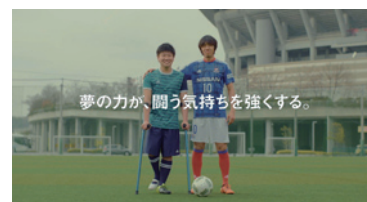
ACジャパン「メイク・ア・ウィッシュ」

JAL「企業」 JT「空 見上げていこう」 富士フイルム「楽しい100歳」 UNIQLO「STETECO&RELACO」 Lee「kids」 NEC「LaVie Z」 サントリー「ザ・プレミアム・モルツ」 adidas「all originals represent」 トヨタ「Get Going Challenge」 アデランス「N-LED ソニック」 Canon「EOS 6D」 ARIMINO「ミントスパークリングシャンブーマイルド」 ネスレ日本「ネスレシアター～通学ダッシュ!～」