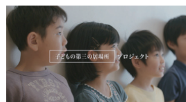
日本財団「第三の居場所」