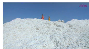
イオン「オーガニックコットン」