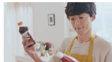
ミツカン「追いがつおつゆ」