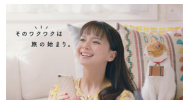
リクルート「じゃらん」