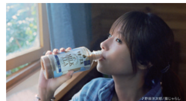
キリンビバレッジ「午後の紅茶」